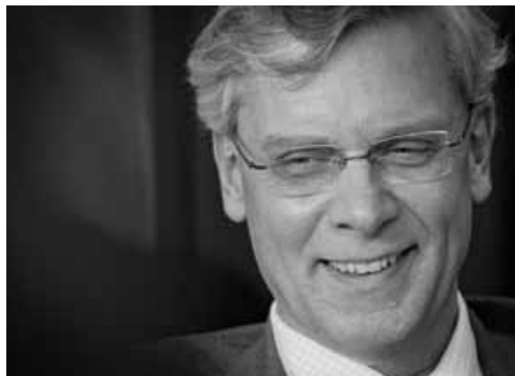
Marnix van Rij voorzitter NOB

U vindt ons jaarverslag ook online op www.nobjaarverslag.net